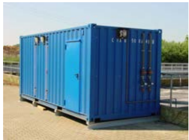
Abb. 1: Lager- und Dosierstation Typ LD11/T – an der Vorderseite sind die Befüllleitungen für die Lagerbehälter, die optischen und akustischen Warneinrichtungen sowie die Dosierleitung zu erkennen. Auf der linken Seite befinden sich neben der Eingangstüre die Füllstandsanzeigen der Lagerbehälter.

Die Steuerung der Anlage bzw. der Dosierpumpen erfolgt über einen Schaltschrank mit SPS-Steuerung und einem SIPART-Kompaktregler, der sich als außerordentlich anwenderfreundlich erwiesen hat. Die Produktdosierung kann nach verschiedenen Funktionen gesteuert bzw. geregelt und mit einfachen Mitteln optimiert werden. Durch die vorhandene induktive Durchflussmessung wird die tatsächliche Dosiermenge erfasst und in Kombination mit dem SIPART-Regler exakt auf die Belastungssituation der Kläranlage angepasst.