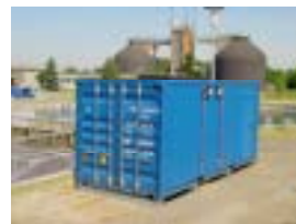
Abb. 3: Rückansicht mit Flügeltür zu den Lagertanks

OnLine-Analysengeräte zur Bestimmung von Phosphat, Nitrat, Ammonium, TOC/TN und Trübungsmessung (TM 3). Datenerfassung und -auswertung zur Steuerung nach dem PRO-ENTEC®-CNP-Konzept. Separater oder größerer Container für Analysengeräte.