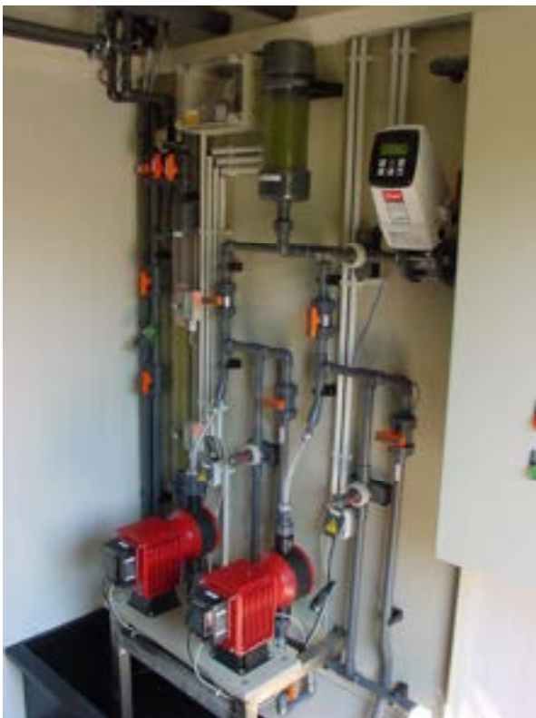
Abb. 2: Dosiereinheit der Lager- und Dosierstation Typ LD11/T

Zur Steuerung der Produktdosierung nach dem PRO-ENTEC®-CNP-Konzept kann die Anlage mit verschiedenen OnLine-Analysengeräten (z.B. Phosphat, Nitrat, Ammonium, Trübung, TOC/TN) ausgestattet werden. Wegen des zusätzlichen Platzbedarfes ist es empfehlenswert, die Analysengeräte in einem separaten Gebäude unterzubringen oder für die Lager- und Dosierstation einen größeren Container zu verwenden.