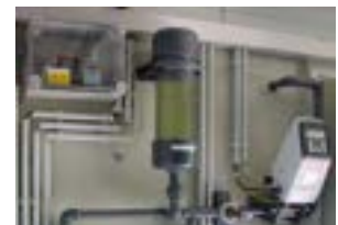
Abb. 4: Ansaughilfe, Pulsationsdämpfer und IDM